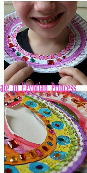
From Panoplate to Egyptian Princess